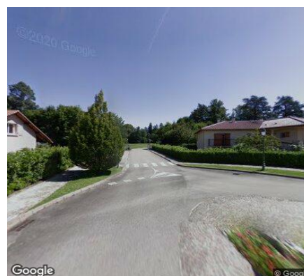
Vue STREET VIEW du secteur